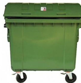
Sklo – 1100 litrová nádoba - zelená

Zberá sa: prázdne sklenené poháre od zaváranín a sklené fľaše od nápojov. Všetko bez farebného rozlíšenia ako sklo zmiešané